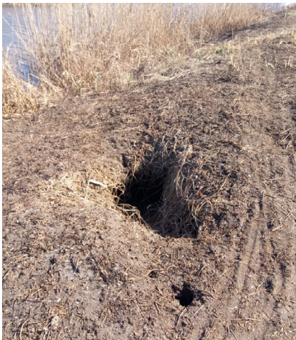
Рис. 11. Нора бобра (канал на східній околиці с. Мильники). Fig. 11. The beaver hole (the channel on the eastern outskirts of the village of Mylnyky).