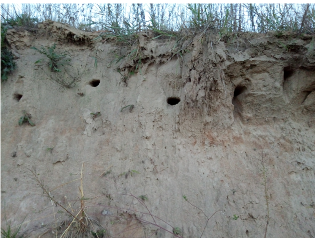
Рис. 13. Норні гнізда берегових ластівок (канал на південь від с. Колісники). Fig. 13. Burrow nests of shore swallows (the channel south of the village of Kolisnyky).