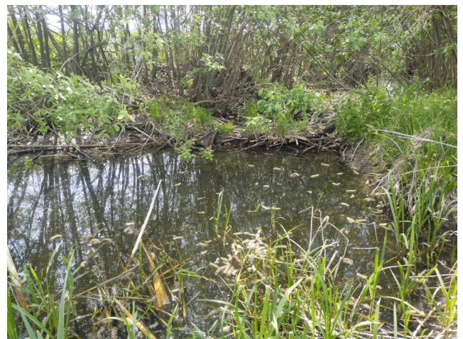
Рис. 14. Боброва гребля (канал на північ від с. Ніжинське). Fig. 14. Beaver dam (the channel north of the village of Nizhynske).