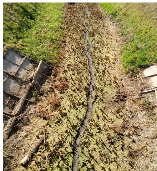
Рис. 2. Канал трапецієподібної форми (східна околиця с. Бурківка) (фото Філоненка Ю. М.). Fig. 2. A trapezoidal channel (the eastern outskirts of the village of Burkivka) (photo by Yu. M. Filonenko).

У перші ж роки свого існування для більшості каналів був характерний переважно V-подібний та, в окремих місцях, параболічний поперечний переріз. З часом, головним чином внаслідок впливу площинного змиву, підземних вод, гравітаційних процесів, антропогенної та вітрової діяльності і біоти, поверхня їх схилів і дна зазнали суттєвих змін. Майже всі канали Ніжинщини стали мати трапецієподібний або полігональний переріз (рис. 2). Одразу після проведення земляних робіт через