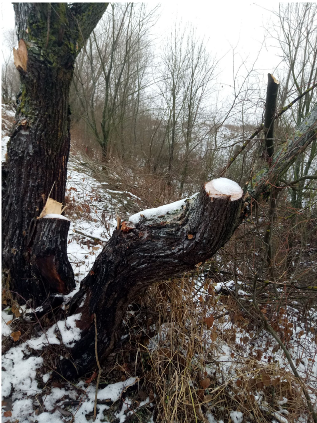
Рис. 15. Місце вирубування верби (західна околиця м. Ніжина).

У каналах з галерейними лісами в останні роки активно проводяться нелегальні вирубування дерев (рис. 15). Як показали польові дослідження, тут має місце вирубування деревостою діаметром від 15-20 см і вище. Найчастіше випилюють вербу, осику, тополю білу (сріблясту), а також дикорослі фруктові дерева – груші, яблуни, абрикос. Здійснюється нелегальна лісозаготівля переважно в зимовий час. Внаслідок такої антропогенної діяльності формуються фітогенно-антропогенні форми рельєфу, які за розміром належать до мікро- та наноформ.