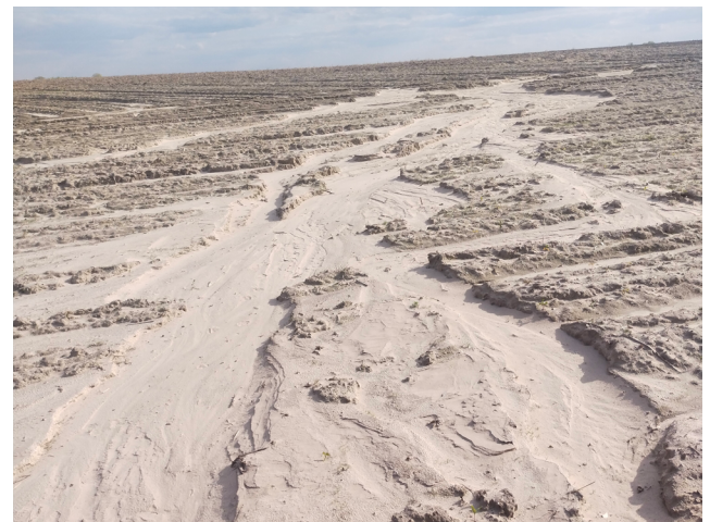
Рис. 6. Розвиток лінійної ерозії на нахиленому полі поблизу каналу (західна околиця м. Ніжин).

Fig. 5. The clay pit site (the western outskirts of Nizhyn).