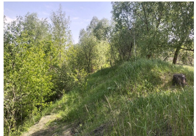
Рис. 4. Меліоративний канал з пасмом неподалік ніжинської окружної дороги.

Fig. 3. A strand next to the reclamation canal (the western outskirts of Nizhyn).