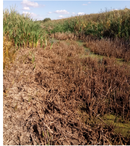
Рис. 10. Формування болота у каналі (східна околиця с. Бурківка). Fig. 10. The swamp formation in the channel (the eastern outskirts of the village of Burkivka).