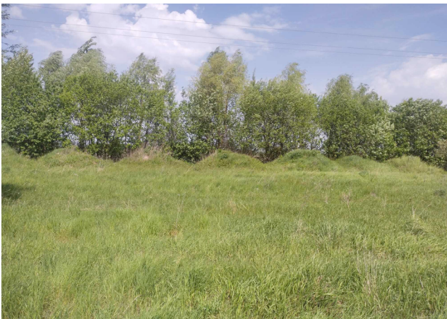
Рис. 3. Пасмо поруч з меліоративним каналом (західна околиця м. Ніжина).

На формування поверхні прибережної території та схилів важливий вплив має також напрямок обробітку ґрунту (особливо при нахилі поверхні поля у бік каналу). Коли оранка (культивування, дискування, висівання тощо) проводиться перпендикулярно до лінії бровки, то виникають умови для формування лінійного змиву внаслідок танення снігу або під час сильних злив (рис. 6).