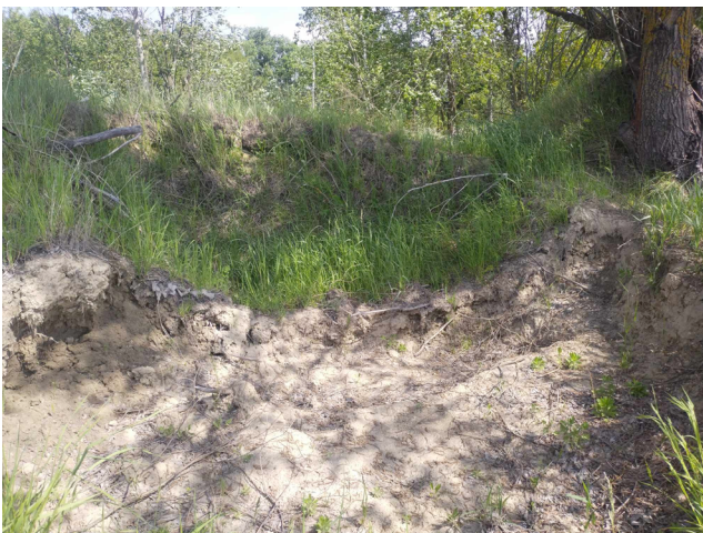
Рис. 5. Місце видобутку глини (західна околиця м. Ніжина) (фото Філоненка Ю. М.).

Fig. 4. Reclamation canal with a strand near the Nizhyn ring road (photo by Yu. M. Filonenko).