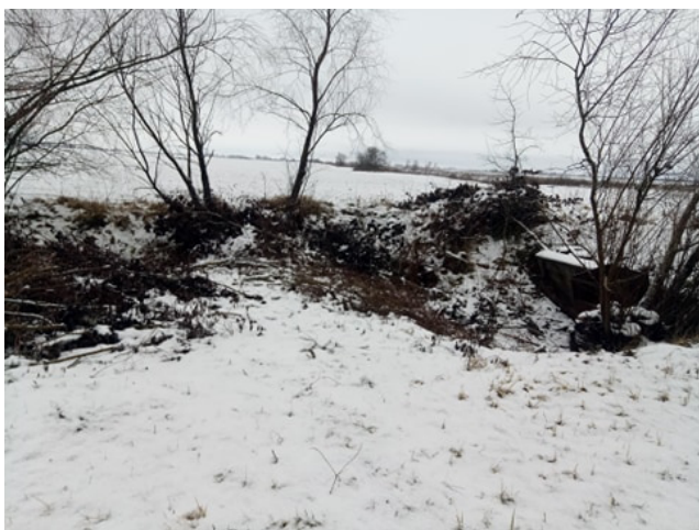
Рис. 7. Дамба перед мостовим переходом поблизу с. Прохори.

Важливу роль у трансформації меліоративних каналів Ніжинщини відіграє також біота. Так, у місцях випасу худоби на схилах каналів фіксуються витягнуті улоговини – скотогінні стежки. Проте останнім часом їх кількість суттєво зменшується через вирівнювання та заростання, оскільки в сільській місцевості стрімко скорочується