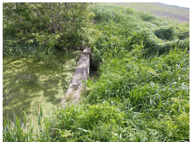
Рис. 8. Руйнування мостового переходу на північ від с. Мильники.

Під час польових робіт перед кількома трубними мостовими переходами нами було виявлено боброві греблі, а в окремих місцях і боброві хатки (рис. 14). Греблі мали висоту в середньому 0,6-0,7 м (одна з виявлених нами гребель досягала висоти 1 м), а їх ширина рідко