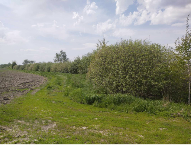
Рис. 9. Галерейний ліс (західна околиця м. Ніжин) (фото Філоненка Ю. М.). Fig. 9. The gallery forest (the western outskirts of Nizhyn) (photo by Yu. M. Filonenko).