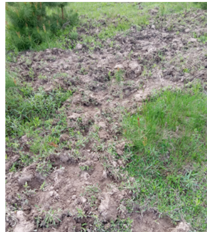
Рис. 12. «Порої» диких свиней (канал на південній околиці с. Пам'ятне). Fig. 12. Wild pigs activity (the channel on the southern outskirts of the village of Pamyatne).